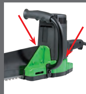
Maniglia montabile su entrambi i lati